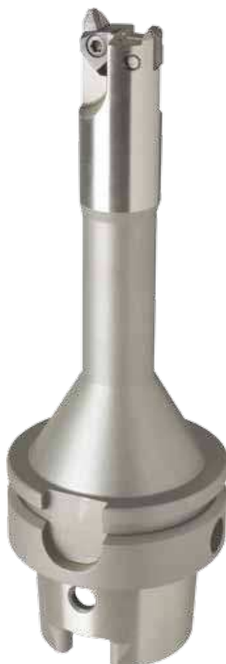
GE 100-Werkzeug mit Formplatten VHM